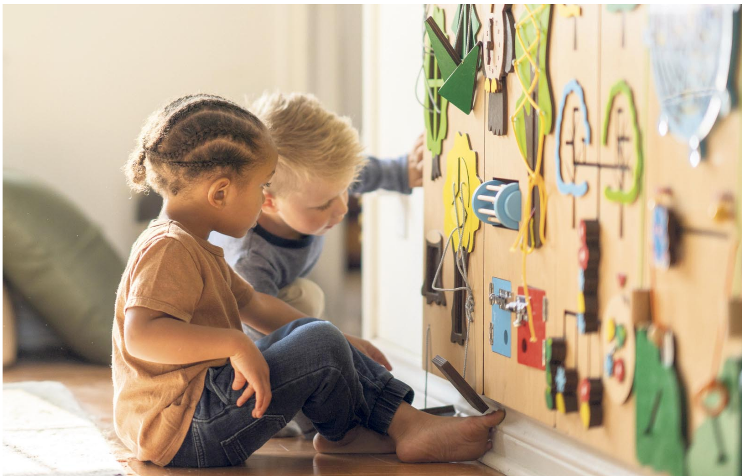
Die ersten Lebensjahre sind für die körperliche, psychische und soziale Entwicklung prägend.